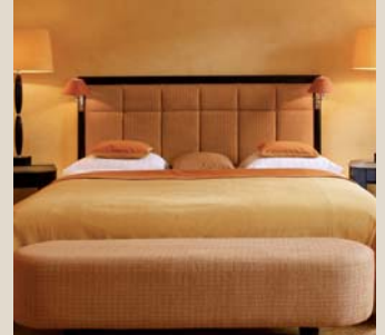
Zimmer im Pilatistil