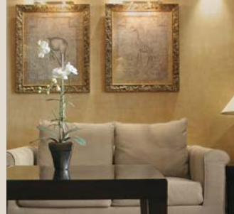
Zimmer im Kolonialstil